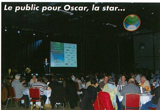
Le public pour Oscar, la star...