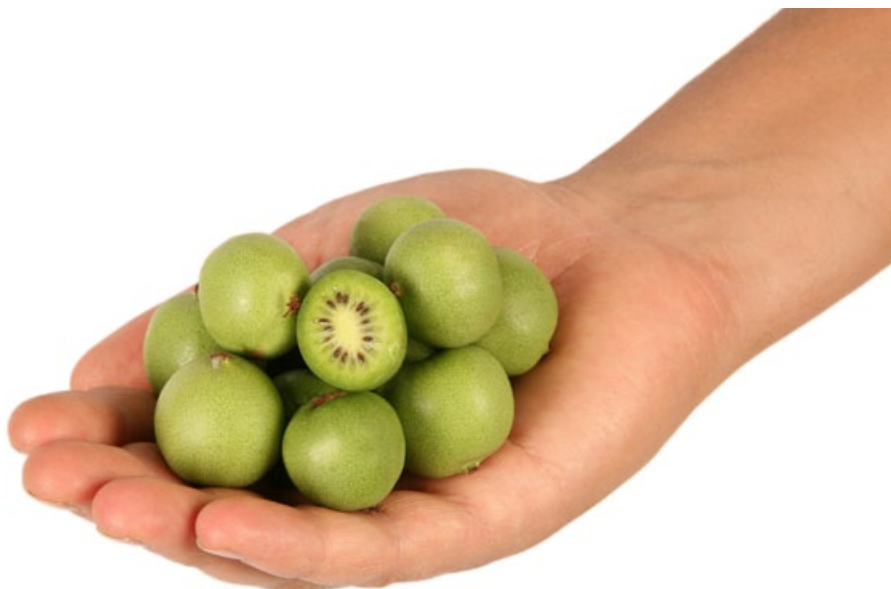
Бэби-киви Oscar Kiwai

мякоть делают плоды Oscar Kiwai превосходной закуской и компонентом оригинальных кулинарных блюд.