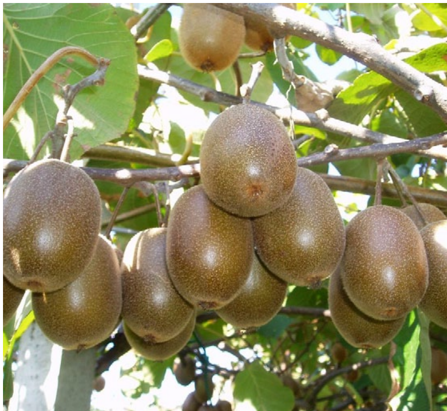
Киви на дереве

Компания «Prim'land» ориентирована в основном на поставку требовательным клиентам широкого ассортимента киви высочайшего качества. Это порядка 13 тыс. т киви сорта Hayward и 1000 т сорта Summerkiwi ™ . Под эти сорта заняты 480 и 80 га соответственно.