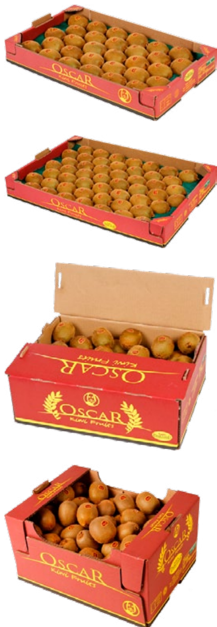
Некоторые образцы упаковок для киви Oscar®

По причине тотальной прослеживаемости всей цепочки поставок продукция «Prim'land» продаётся на французском рынке также со знаком Label Rouge (см. красно-белый овал на рекламном модуле). Данный «красный ярлык», наклеиваемый на каждый плод и каждую упаковку с киви, символизирует гарантию высшего качества и является весьма узнаваемым у французских потребителей. Label Rouge имеют 80% киви, выращиваемых в долине Адюра.